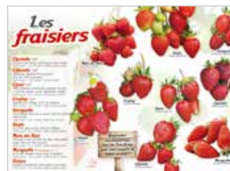
• LES FRAISIERS