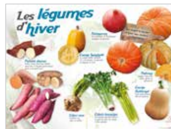
• LES LÉGUMES D'HIVER (POTIRONS, PATATES DOUCES,...)