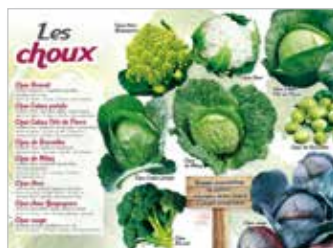
• LES CHOUX