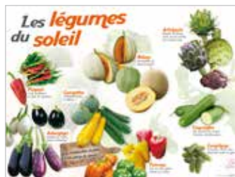
• LES LÉGUMES DU SOLEIL (POIVRONS, MELONS,...)