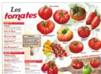
• LES TOMATES