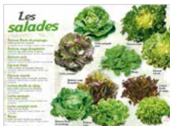
• LES SALADES